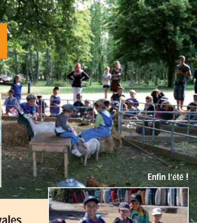
Enfin l'été !