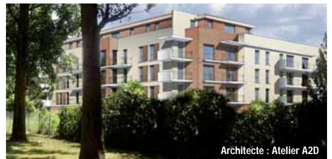
Architecte : Atelier A2D

Le projet consiste en la construction d'un bâtiment sur 5 étages (rez de chaussée + 4 étages) réparti en 17 deux-pièces, 29 trois-pièces et 4 quatre-pièces. Le retour Sud du bâtiment ne comporte que 4 étages (R+3). Un niveau de sous-sol de 35 places de parking dont 3 pour personnes à mobilité réduite (PMR) se situe sous le bâtiment pour préserver une grande partie de pleine