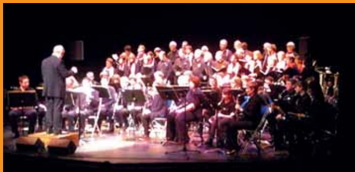
22 décembre Concert de Noël par l'Ensemble vocal et la Société musicale de Mennecey