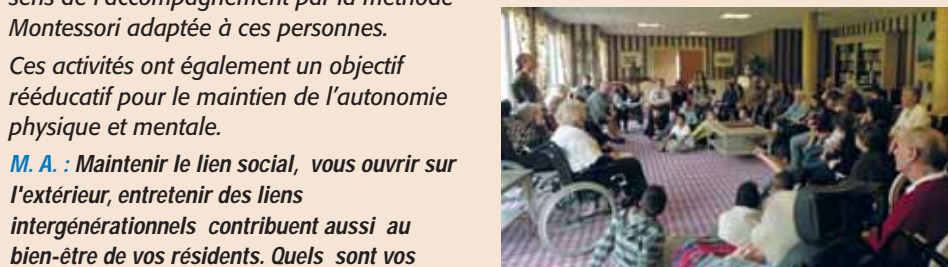
Rencontre avec les élèves de l'école de la Jeannotte