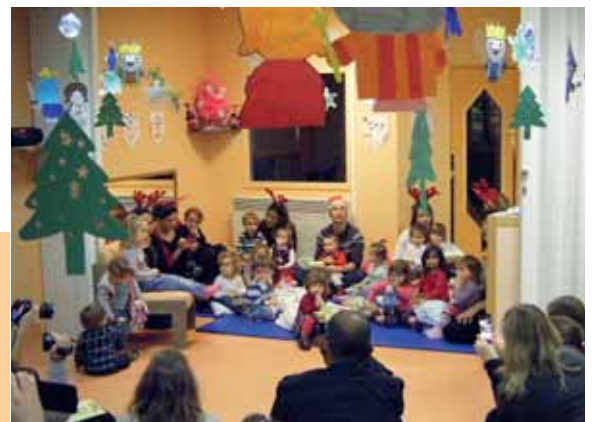
18 décembre Fête de Noël à la crèche Jean Bernard