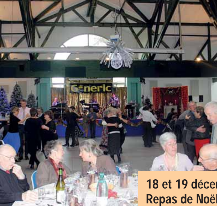
18 et 19 décembre Repas de Noël du "Bel Age"