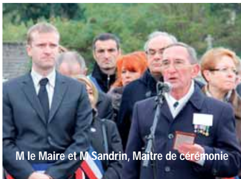
M le Maire et M Sandrin, Maître de cérémonie