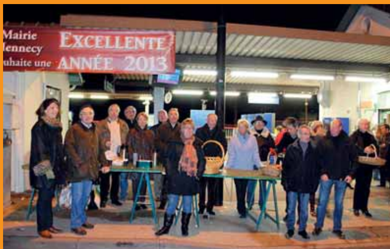
7 janvier 2013 Le conseil municipal souhaite une bonne année avec café et croissants aux usagers de la SNCF

organisée par le CCAS - Spectacle de transformistes suivi d'un gouter- cocktail