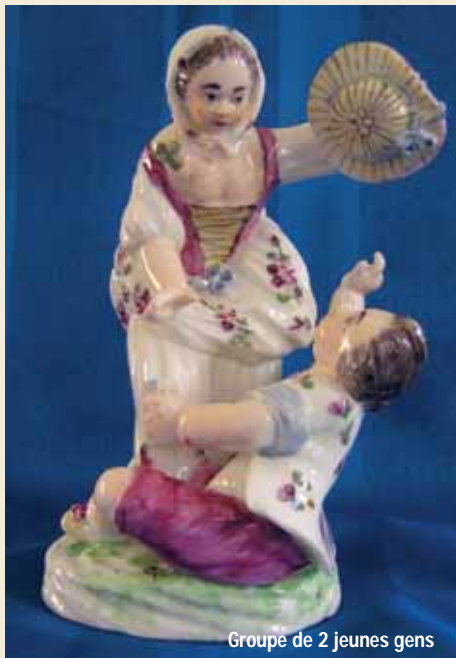
Groupe de 2 jeunes gens