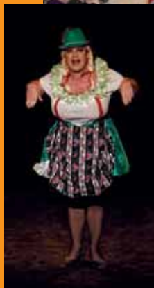
31 décembre Fête de la Saint- Sylvestre

organisée par le CCAS - Spectacle de transformistes suivi d'un gouter- cocktail