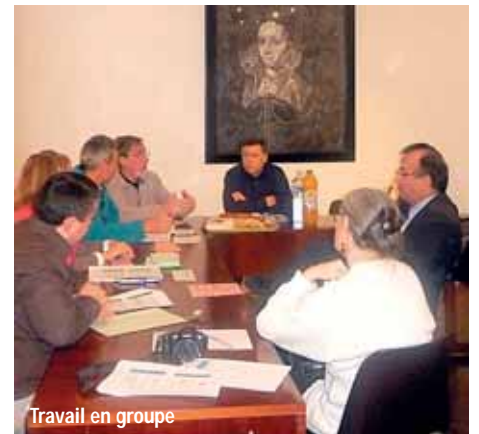
Travail en groupe