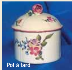
Pot à fard

La Municipalité, consciente de l'intérêt culturel de cette production locale, recherchée par les amateurs de la