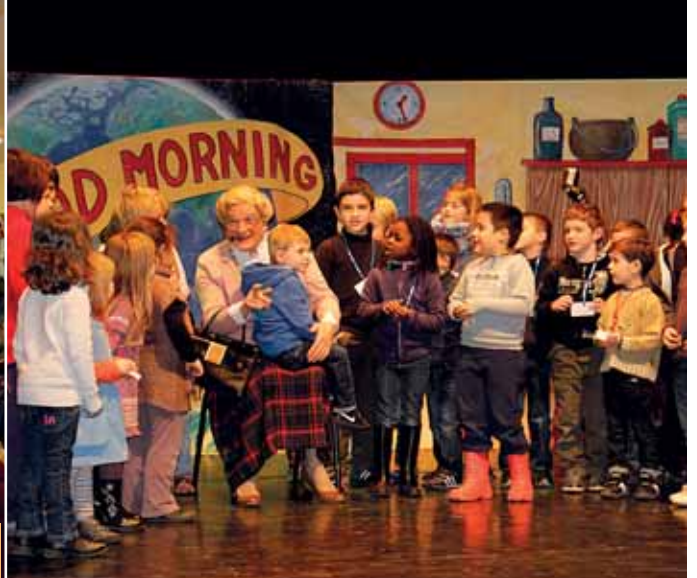
12 décembre Noël des enfants du personnel municipal et du centre de loisirs