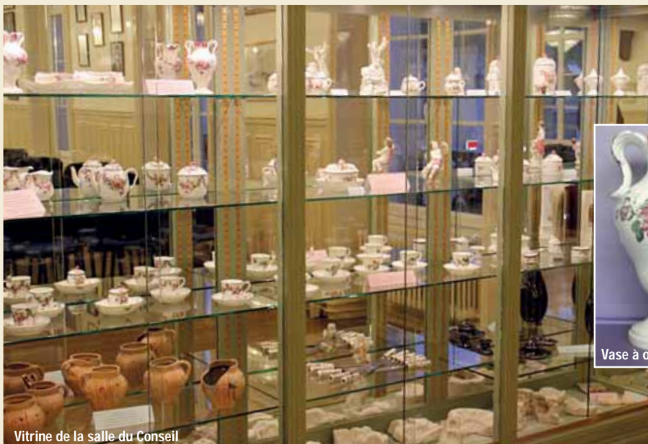
Vitrine de la salle du Conseil

contacter le Cabinet du Maire tél 01.69.90.80.31.