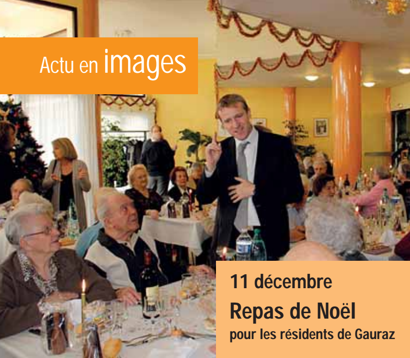
11 décembre Repas de Noël pour les résidents de Gauraz