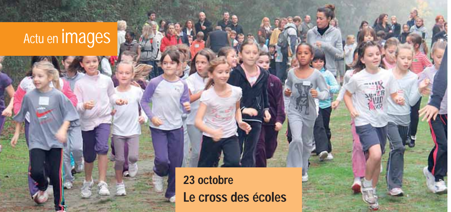
23 octobre Le cross des écoles

1 er au 4 novembre mise en place du pont-rail de la future déviation qui permettra la suppression du passage à niveau de la gare.