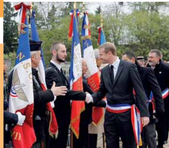
11 novembre Commémoration de l'armistice du 11 novembre 1918 célébrée conjointement et successivement à Fontenay le Vicomte, Ormoy et Mennecy