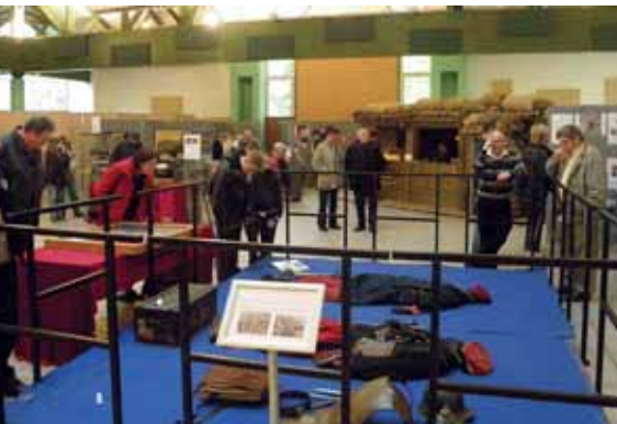
9 au 13 novembre Exposition sur la Grande Guerre Beau succès pour cette 1 ère exposition qui a accueilli 1750 visiteurs dont 660 scolaires (15 classes du CE2 à la 3 ème )