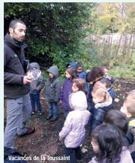
Vacances de la Toussaint