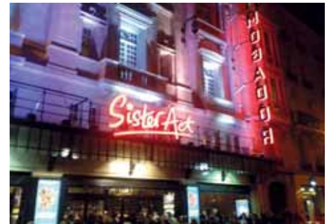
9 novembre Sister Act au Théâtre Mogador avec le Pôle loisirs Découvertes